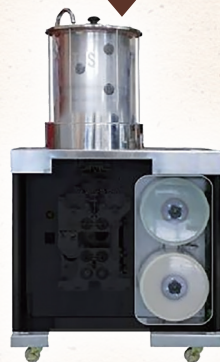
煎自動マイスター

あらい薬局では、生薬エキス抽出機(煎じ釜)と、 煎じ薬を自動分包する包装機が一体化した 自動生薬煎じ包装機(煎自動マイスター)を導入し、 漢方薬の煎じパック詰めサービスを行っています。